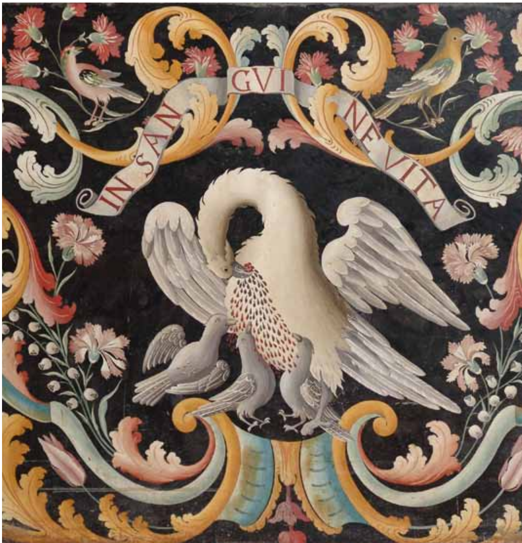
Perugia, Chiesa di San Domenico, Paliotto Altare Maggiore - 1° quarto del XVIII sec.